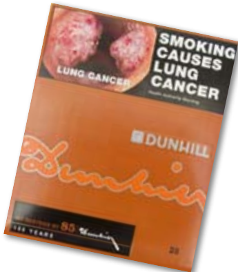
لون التنبيه الصحي يضع في لون العلب (أحد أصناف Dunhill من أستراليا)

بدون الصور الخاصة بالصنف ستصبح العلب مجرد "أوعية مهمتها حفظ السجائر" ولا شيء سواه. بدلاً من أن تكون وسطاً للإعلان. 27