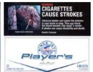
استخدام الألوان لإعطاء انطباع بقلّة الضرر النسبي (أحد أصناف Player من كندا)