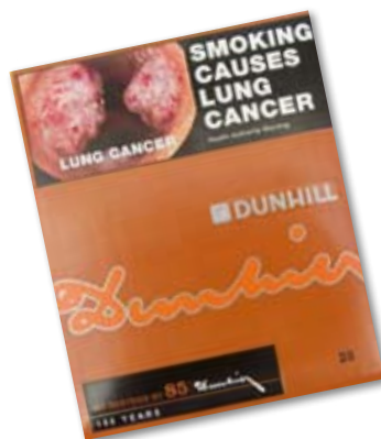
La couleur des avertissements sanitaires se fond dans celle du paquet (marque Dunhill d'Australie)

Dépourvus d'image de marque, les paquets deviendraient de simples « contenants fonctionnels de cigarettes », au lieu d'être des supports publicitaires. 27