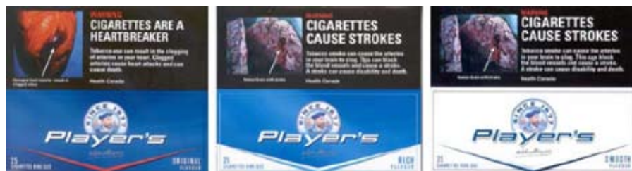
Utilisation de la couleur pour suggérer une nocivité relative (marque Player's du Canada)