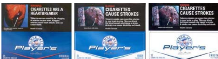
Использование цвета для создания впечатления об относительной безвредности (бренд Player's из Канады)