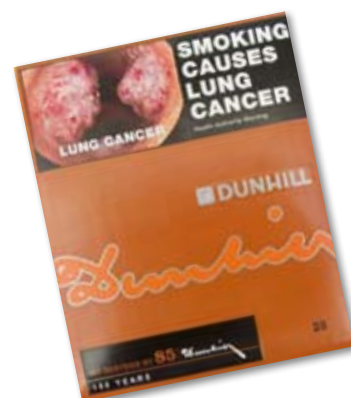
Цвет предупреждений о последствиях для здоровья сливается с цветом пачки (бренд Dunhill из Австралии)

Без брендовых изображений пачки станут ничем иным, как «функциональными вместительными сигарет», а не средством рекламы. 27