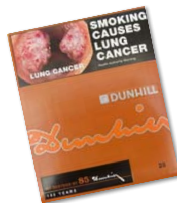
El color de las advertencias de salud se mezclan y difuminan con el color del paquete (marca Dunhill de Australia).

Sin imágenes de la marca, los paquetes pasarían a ser nada más que “envases funcionales para los cigarrillos”, en vez de un medio de publicidad. 27