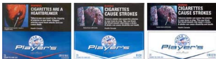
El uso de color para sugerir relativa nocividad (marca Player's de Canadá).