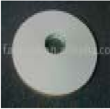
Le papier à tabac en rouleaux (non à l'échelle) 3