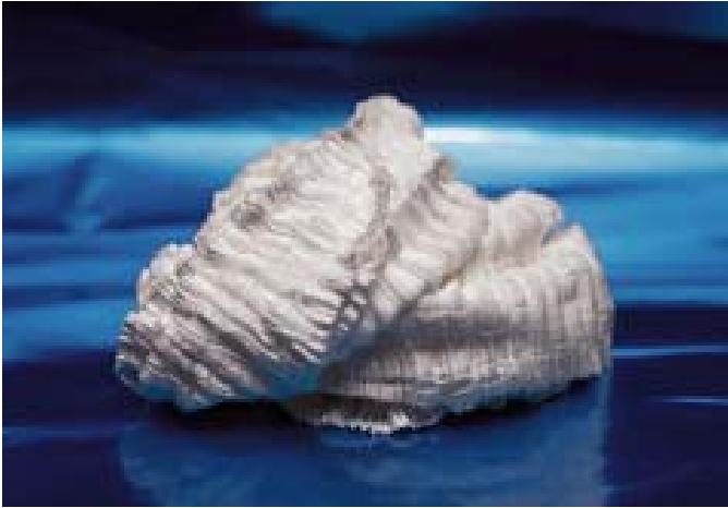
Mèche à filtre RHODIA® 4