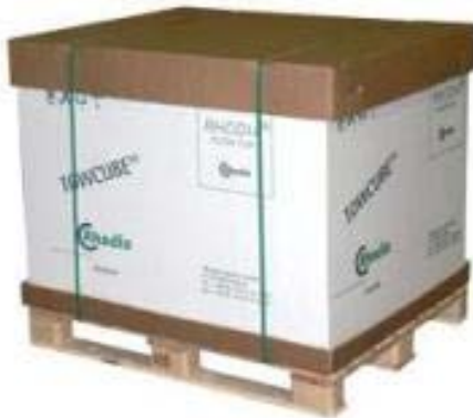
Mèche à filtre RHODIA® Charge cubique 5