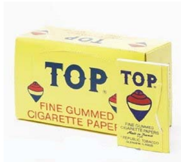
Les papiers à tabac en cahiers (non à l'échelle) 2