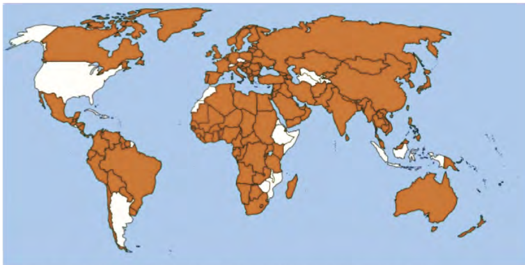
截至2011年5月, 已有173名缔约方认可《公约》, 占全世界人口的87%。