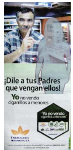
Campaña en Honduras

Yul Francisco Dorado Mazorra Corporate Accountability International / NATT