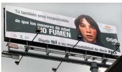
Campaña en Colombia

En Honduras, la implementación del Convenio se ha encontrado con la férrea oposición de la industria tabacalera y hasta la fecha no se ha expedido la ley de control del tabaco. Si cursa un proyecto de ley que ya cuenta con un dictamen favorable de la Comisión de Salud, pero que en esencia esta distante de las principales formulaciones del CMCT.